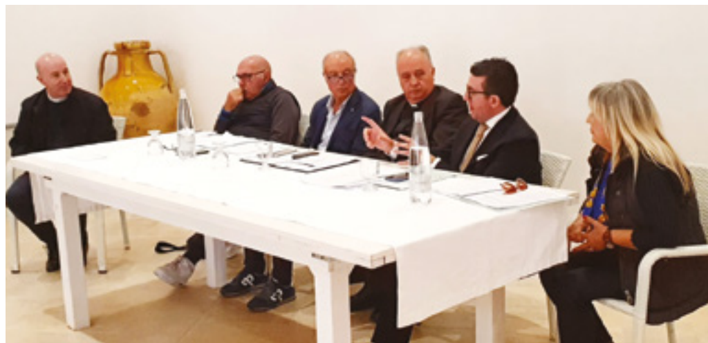
a sinistra Il tavolo della Presidenza