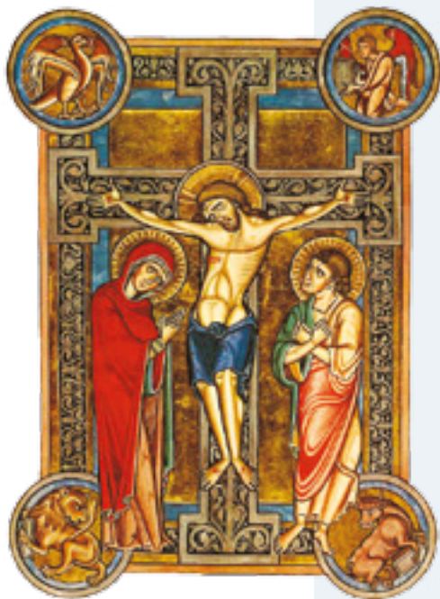
sopra Gesù crocifisso e i 4 Evangelisti [Messale di Weingarten, 1217, Morgan Library, New York]