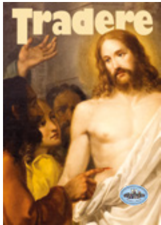
Venezia (Venezia), Italia. Il dipinto di Gesù Cristo risorto con Tommaso apostolo e altri apostoli di Sebastiano Santi nella chiesa dei Santi Apostoli.

Gli articoli rispecchiano esclusivamente le opinioni degli autori e comunque non impegnano in alcun modo il notiziario. Il materiale ricevuto in Redazione non verrà restituito e comunque non costituisce diritto o prelazione per la relativa pubblicazione.