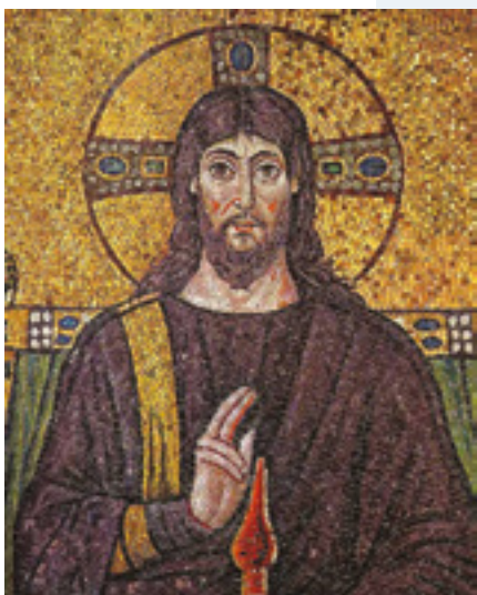
sopra Mosaico di scuola ravennate italo-bizantina - Cristo tra gli angeli, particolare [anno 526]

Ci siamo trovati: delegati da 11 diverse nazioni erano presenti al Forum Paneuropeo di Lugano, e ci siamo posti sotto la protezione della Regina Confessorum Fidei . Abbiamo ricevuto parole di sincero incoraggiamento dai nostri pastori; abbiamo ascoltato parole di partecipazione; abbiamo visto gioia e interesse; abbiamo osservato impegno; abbiamo ottenuto adesione; abbiamo iniziato a vivere insieme la responsabilità comune, che dovrà portare le confraternite a rispondere all'appello che i Vescovi europei hanno voluto "gridare": Svegliati, Europa! / Riscopri le tue radici, Europa! / Rallegrati, Europa, della bontà del tuo popolo.