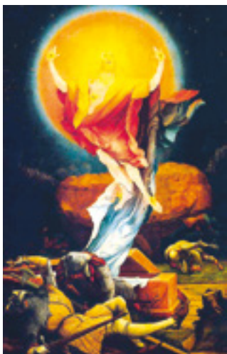
sopra Matthias Gruenewald [1480-1528] - Cristo risorto

contemporaneità. Rapportarsi a un defunto è un rapporto estetico: la sua vita ha perduto il pungolo, non giudica la mia vita, mi permette di ammirarlo e mi lascia anche vivere in tutt'altre categorie: non mi costringe a giudicare in senso decisivo”.