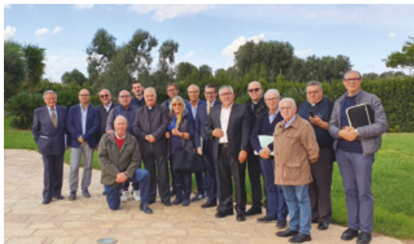
sopra La rituale foto di gruppo